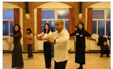
莎莎舞教学与联谊